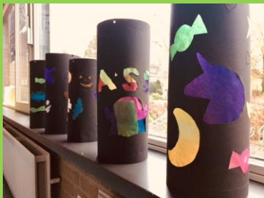
Lampionnen van groep 7-8.