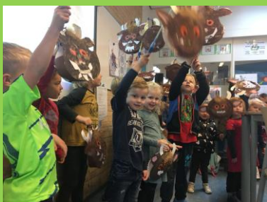
Kleuters komen langs in groep 7-8 om hun mooie lampionnen te laten zien.